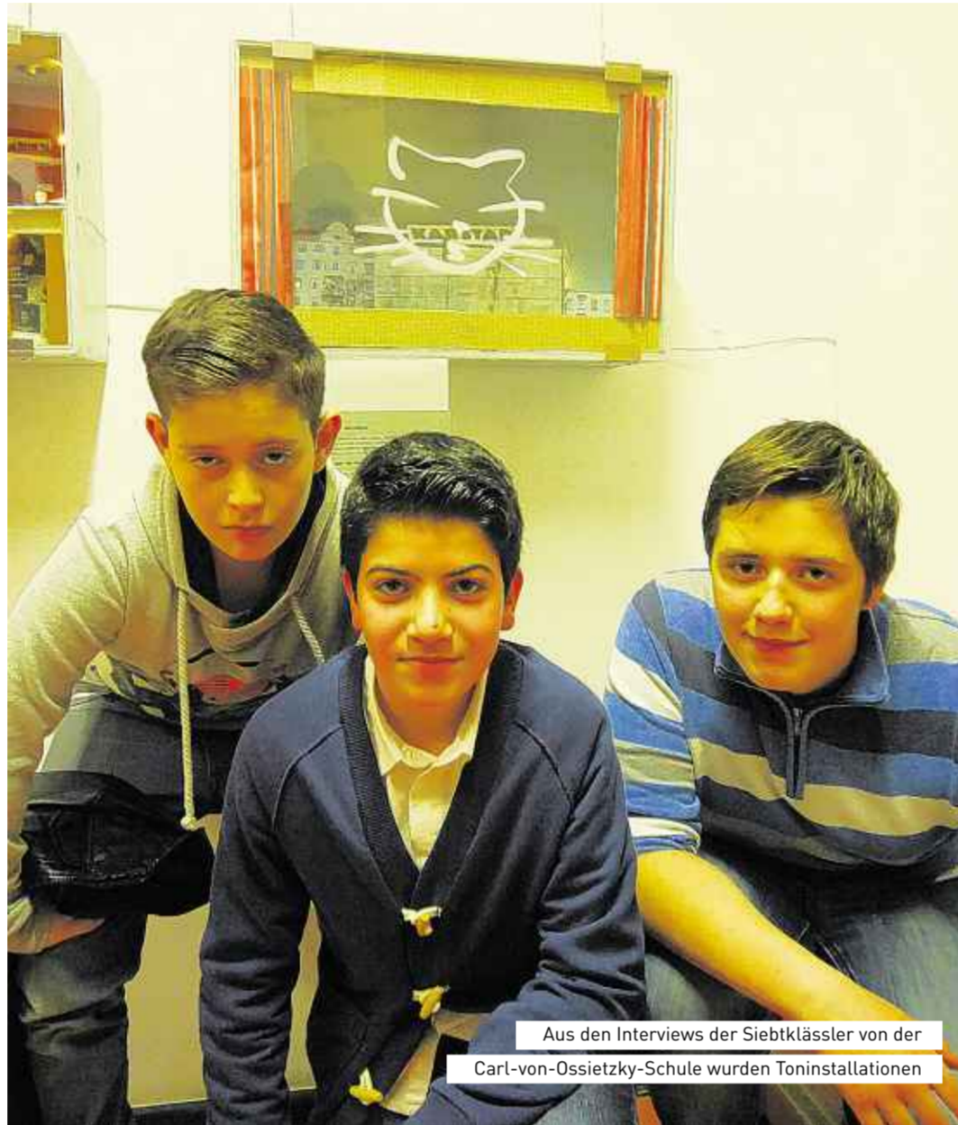
Aus den Interviews der Siebtklässler von der Carl-von-Ossietzky-Schule wurden Toninstallationen

Objekt Wohnumfeld. Die Kooperation zwischen Stadtmuseum und Schule ist durch das Modellprogramm „Kulturagenten für kreative Schulen“ initiiert. Das Projekt